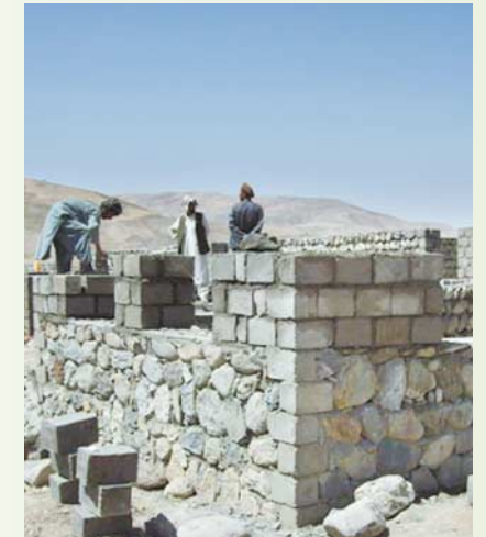
Der Bau in Badakhshan geht gut voran. Noch vor dem Wintereinbruch soll der Schulbetrieb in Share Safar beginnen.

wasserbrunnen gebaut. Ein Luxus für die 473 Kinder und Jugendlichen, die bislang zumeist in Zelten unterrichtet werden – ohne Strom, Toiletten und Schulmöbel. Damit auch die örtliche Wirtschaft von dem Projekt profitiert, wird der Bau der Schule von lokalen Bauunternehmen durchgeführt. Ihnen stehen zwei Techniker und Ingenieure der Bundeswehr zur Seite. Rechtzeitig vor dem Einbruch des Winters soll der Bau der Schule abgeschlossen sein. Mit der humanitären Unterstützung verknüpft Lachen Helfen e.V. auch die Hoffnung, dass die deutschen Truppen, die – oftmals unter widrigen Umständen – Wiederaufbauhilfe in Afghanistan leisten, nicht lediglich als Besatzer geduldet, sondern als Partner begrüßt werden.