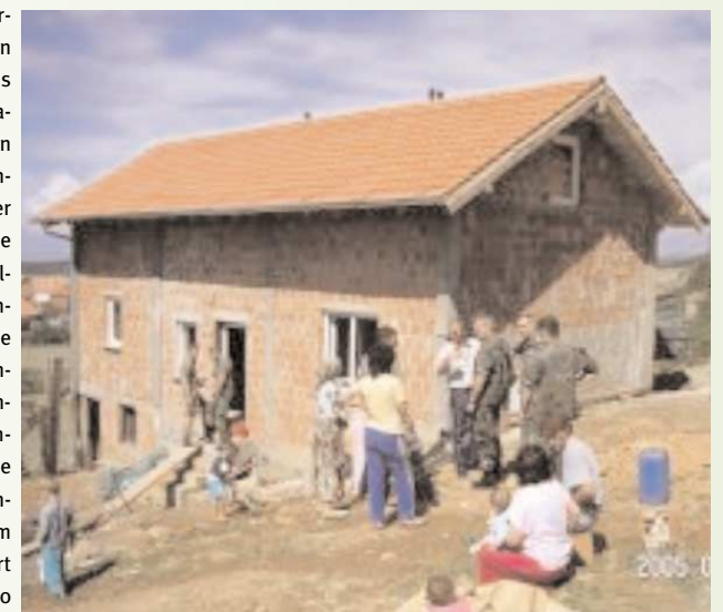
Den fertig gestellten Rohbau des neuen Hauses für die Großfamilie im Kosovo finanzierte Lachen Helfen e.V.

Hier musste geholfen werden: Deutsche Soldaten vor Ort erkannten das Schicksal, das der Großfamilie in ihrer armseligen Behausung bei Wintereinbruch drohte. Pioniere der „Multinationalen Brigade Südwest“ (MNB SW) stellten im August einen Rohbau fertig, den die Familie bereits im Sommer begonnen hatte. Nun wird der Innenausbau zügig durchgeführt, damit die Familie noch vor dem Wintereinbruch in ihr neues Heim einziehen kann. Finanziert wurde der Bau mit 12.000 Euro von Lachen Helfen e.V. Um die einheimische