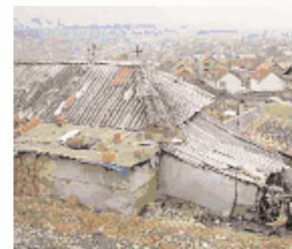
In diesem völlig verrotteten Gebäude mussten die 13 Personen der Familie Bytyqi bis vor kurzem leben.

Eine warme Wohnung, ein dichtes Dach über dem Kopf und menschenwürdige Platzverhältnisse; diese Vorstellungen von Wohnraum