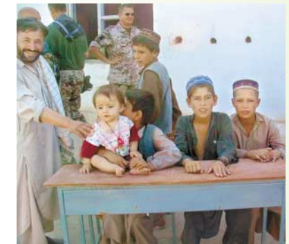
Lachen Helfen e.V. setzt auf nachhaltige Hilfe und unterstützt deshalb zahlreiche Schulprojekte in Afghanistan und dem Kosovo.